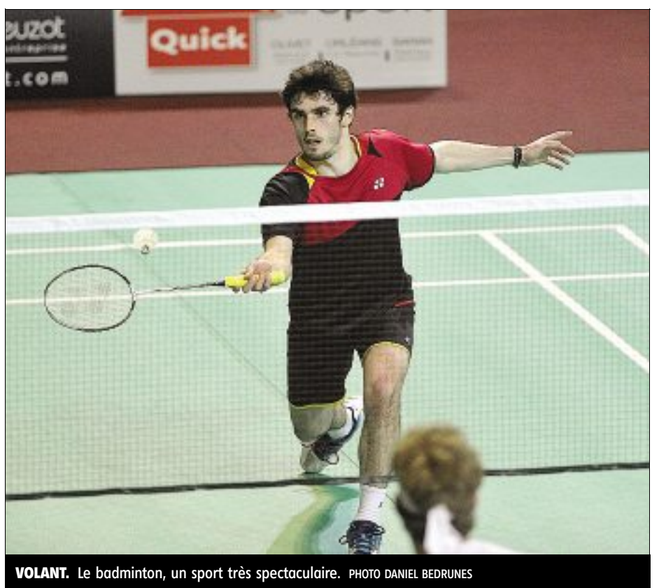
VOLANT. Le badminton, un sport très spectaculaire.

Le plateau donne raison à Franck Laurent : trente joueurs du top cinquante mondial sont attendus.